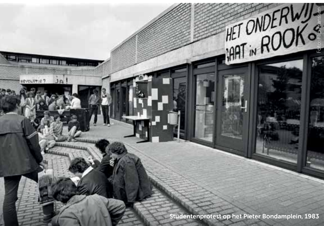
Studentenprotest op het Pieter Bondamplein, 1983