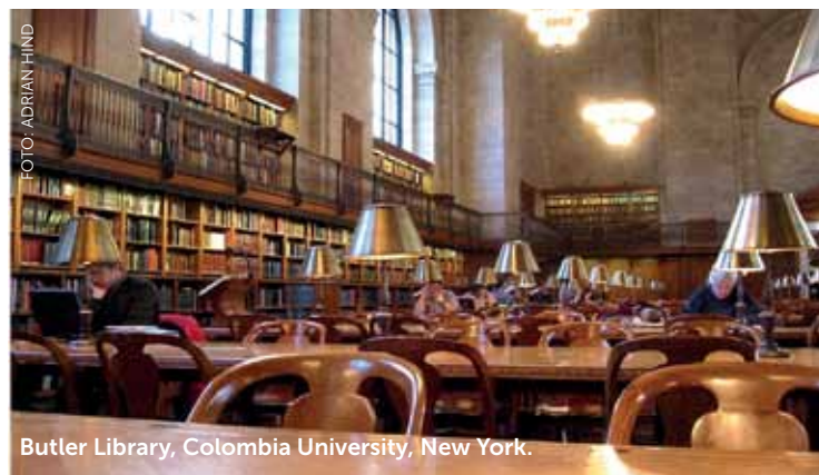
Butler Library, Columbia University, New York.

Of er in Nijmegen ook genoeg animo is voor nachtelijke studeerplekken, is de vraag. Van Soest denkt dat we het er op zouden moeten wagen. “Verruim de openingstijden en kijk wat de studenten doen. Langer open blijven past in deze tijd en je ziet dat steeds meer bibliotheken in die trend meegaan.”