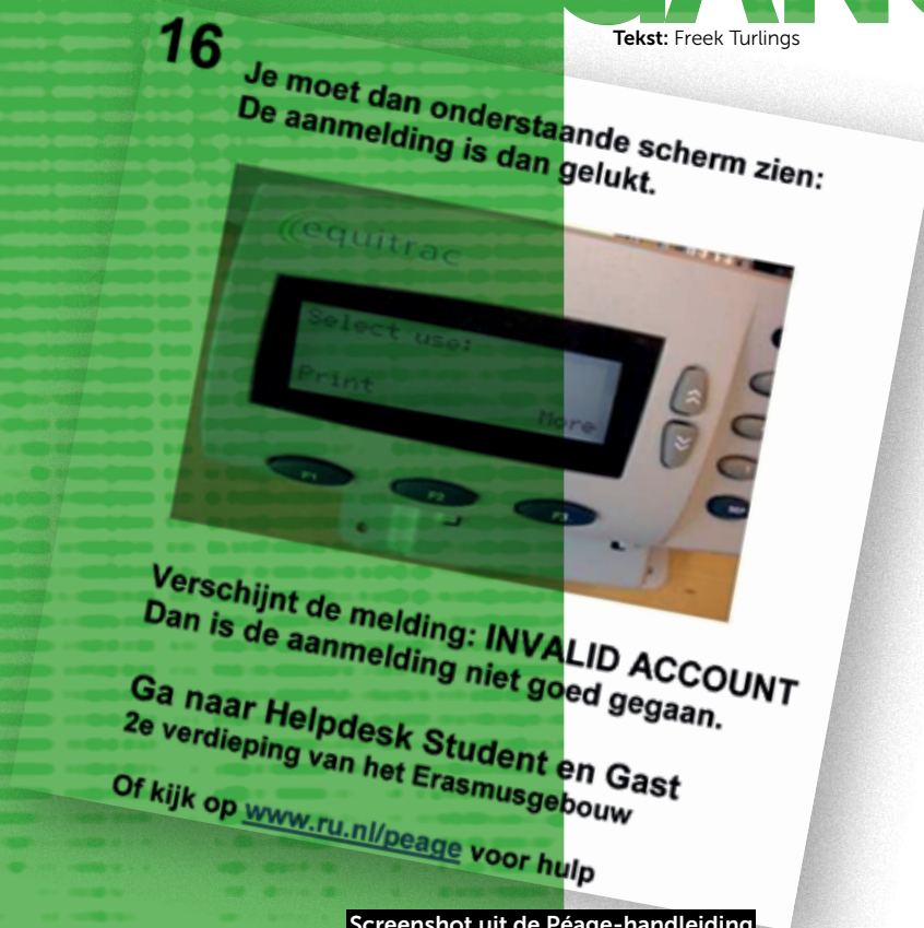
Screenshot uit de Péage-handleiding