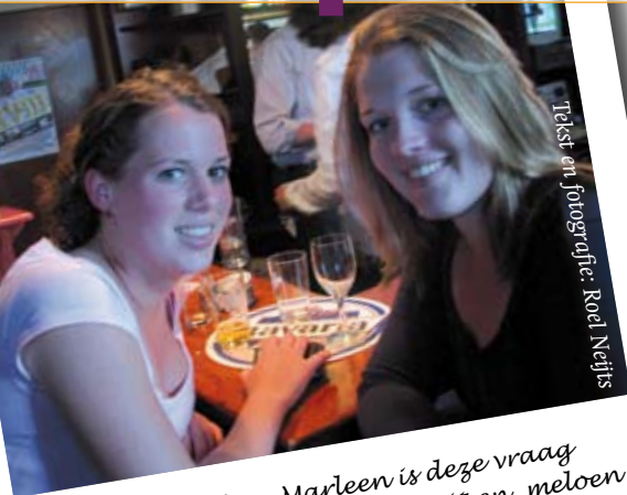
Tekst en fotografie: Roel Neljfs

Waar is het te doen? Op vrijdag 23 mei, tijdens de hypnoseshow van Ovum Novums Diesweek, vroeg uw Vox-verslaggever zich af wat de bezoekers nooit zouden doen onder hypnose.