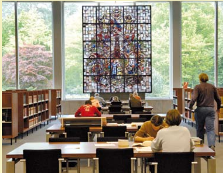
Studeren in de UB

belangrijke rol gespeeld in de aanleg van deze zebrapaden.