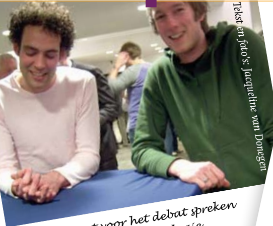
Tekst en foto's: Jacqueline van Dongen

Waar is het te doen? Op maandag 10 maart verscheen uw Vox-verslaggever bij een debat in het stadhuis, waar minister Plasterk debatteerde met studenten.