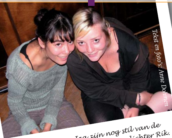
Tekst en foto's: Anne Dohmen

Waar is het te doen? Uw Vox-verslaggever wrong zich op donderdag 13 september door de mensenmassa in het Cultuurcafé naar voren en stemde mee op de eerste Nijmeegse campusdichter. Zie ook www.voxlog.nl voor een filmpje van de avond inclusief een exclusief interview met Spinvis