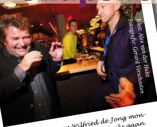
Tekst: Alex van der Hulst

Waar is het te doen? Vox trok de literaire schoenen aan en ging op zaterdag 1 december schrijvers kijken op de afsluitende avond van het Wintertuinfeest in de Lindenberg.