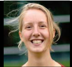
Lean Arts (18)